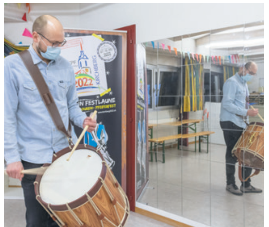
Volle Konzentration und intensives Training, inklusive des kurzen Haltungs-Kontrollblicks.